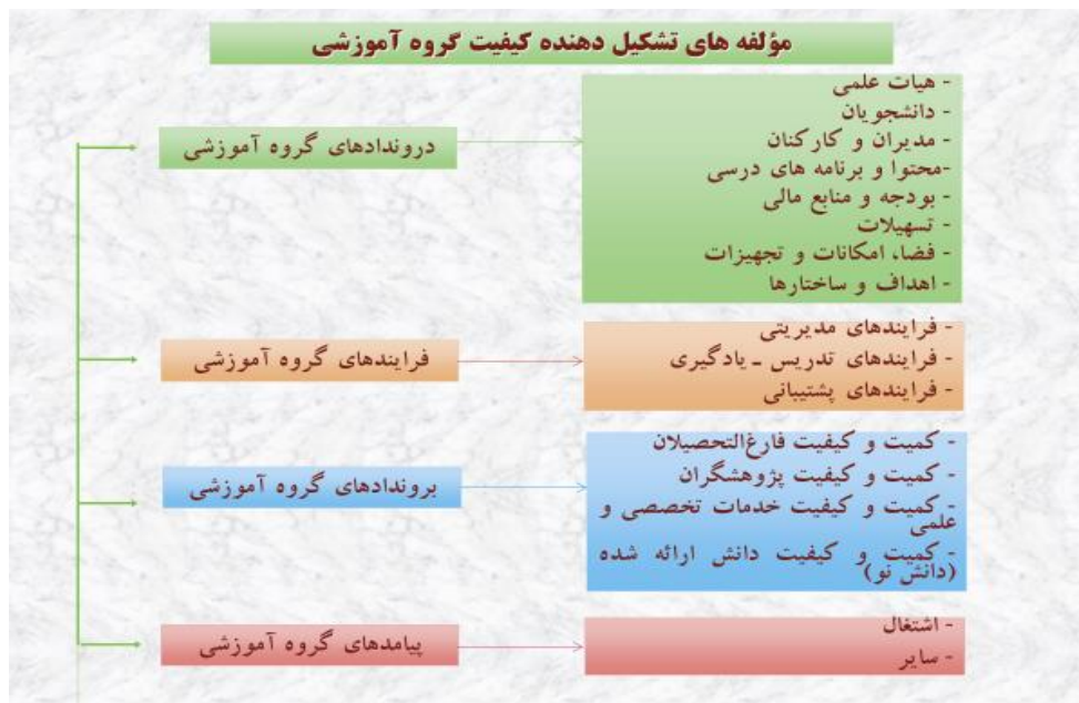
نمودار (۲) بیان‌گر عوامل مورد ارزیابی در گروه آموزشی

درون‌داد، فرایند، برون‌داد و پیامد تقسیم‌بندی کرد. نمودار شماره ۲، بیان‌گر مؤلفه‌های تشکیل دهنده کیفیت گروه آموزشی است. پس از تعیین عوامل مورد ارزیابی، لازم است اجزای هر عامل تدوین شود. برای نمونه اگر کمیته‌ی ارزیابی گروه آموزشی فیزیک در دانشکده‌ی علوم، «تدریس و آموزش» را به‌عنوان یک عامل مورد ارزیابی در نظر گرفته باشد، اجزای این عامل می‌تواند شامل موارد زیر باشد: کیفیت تدریس، ارتباط بین فردی، استفاده از فناوری اطلاعات و ارتباطات ارزشیابی درس.